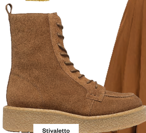
Stivaletto con suola flatform GEOX 149,90 euro.