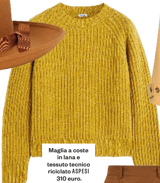
Maglia a coste in lana e tessuto tecnico riciclato ASPESI 310 euro.