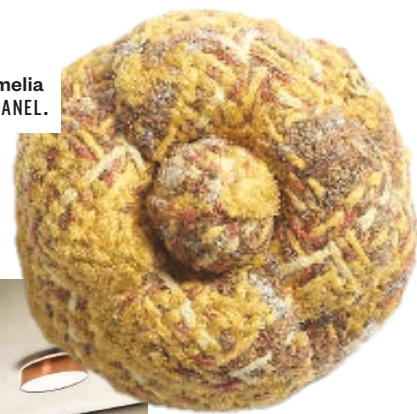
Spilla camelia in tweed CHANEL.

ODE ALLA NATURA Le quaranta camere del Seehof Nature Retreat sono concepite con arredi di design e materiali che richiamano il cromatismo della terra.