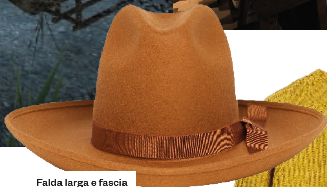
Falda larga e fascia in gros grain ALANUI 300 euro.

lago balneabile. Dopo una passeggiata tra i sentieri si può gustare la cena gourmet al ristorante: la signora Tamaris, perfetta padrona di casa, potrà consigliare piatti della tradizione altoatesina e il vino locale da assaporare a fine pasto in biblioteca, dove godere della quiete mentre si ammira la luna riflessa sull'acqua del lago e il cielo punteggiato di stelle. Se si soggiorna in un posto così, nel bagaglio non deve mancare una maglia tricotata, un caldo cappotto lungo e scarponcini comodi per affondare nella coltre di foglie autunnali. Più un bel libro (perché l'atmosfera è quella giusta anche per immergersi nella lettura) come I falò dell'autunno di Irene Némirovsky.