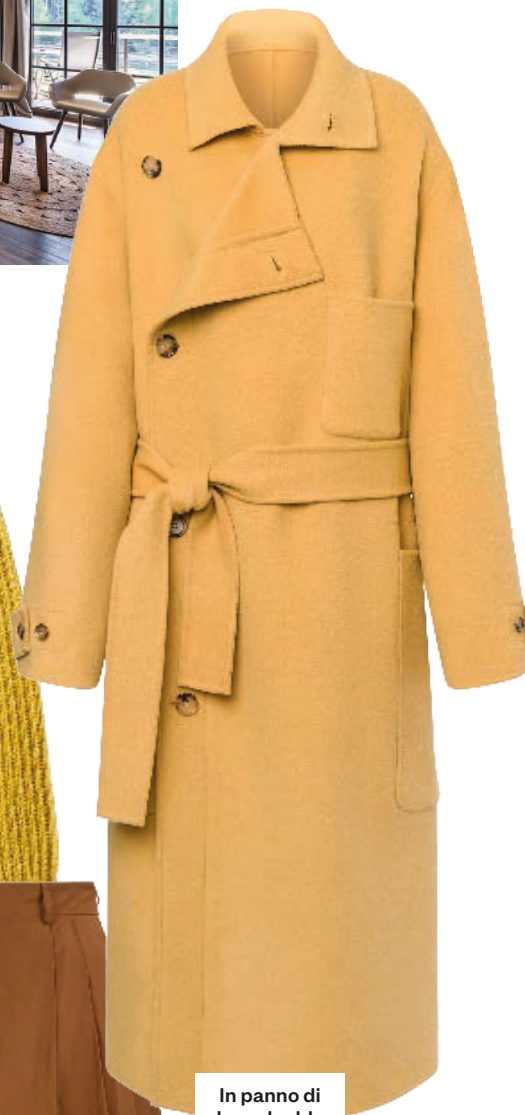
In panno di lana double PHILOSOPHY DI LORENZO SERAFINI 1.355 euro.