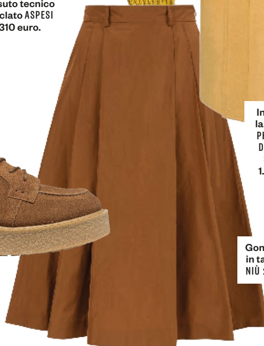
Gonna a faldoni in taffetà NIÙ 221 euro.